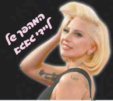
אחפך של זידי אאא